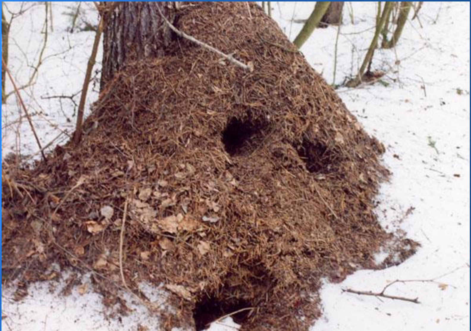
Работа дятла желна.