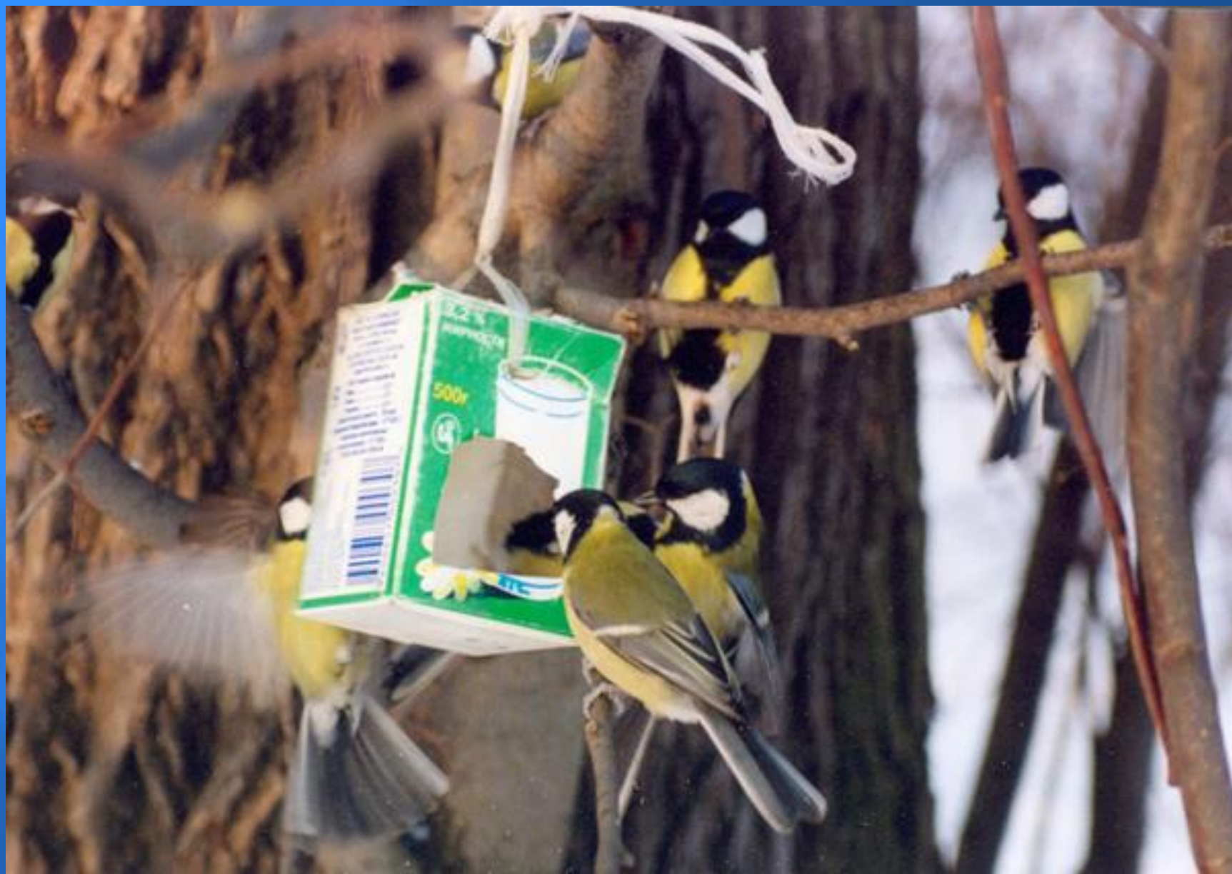
Перед стайкою синиц.