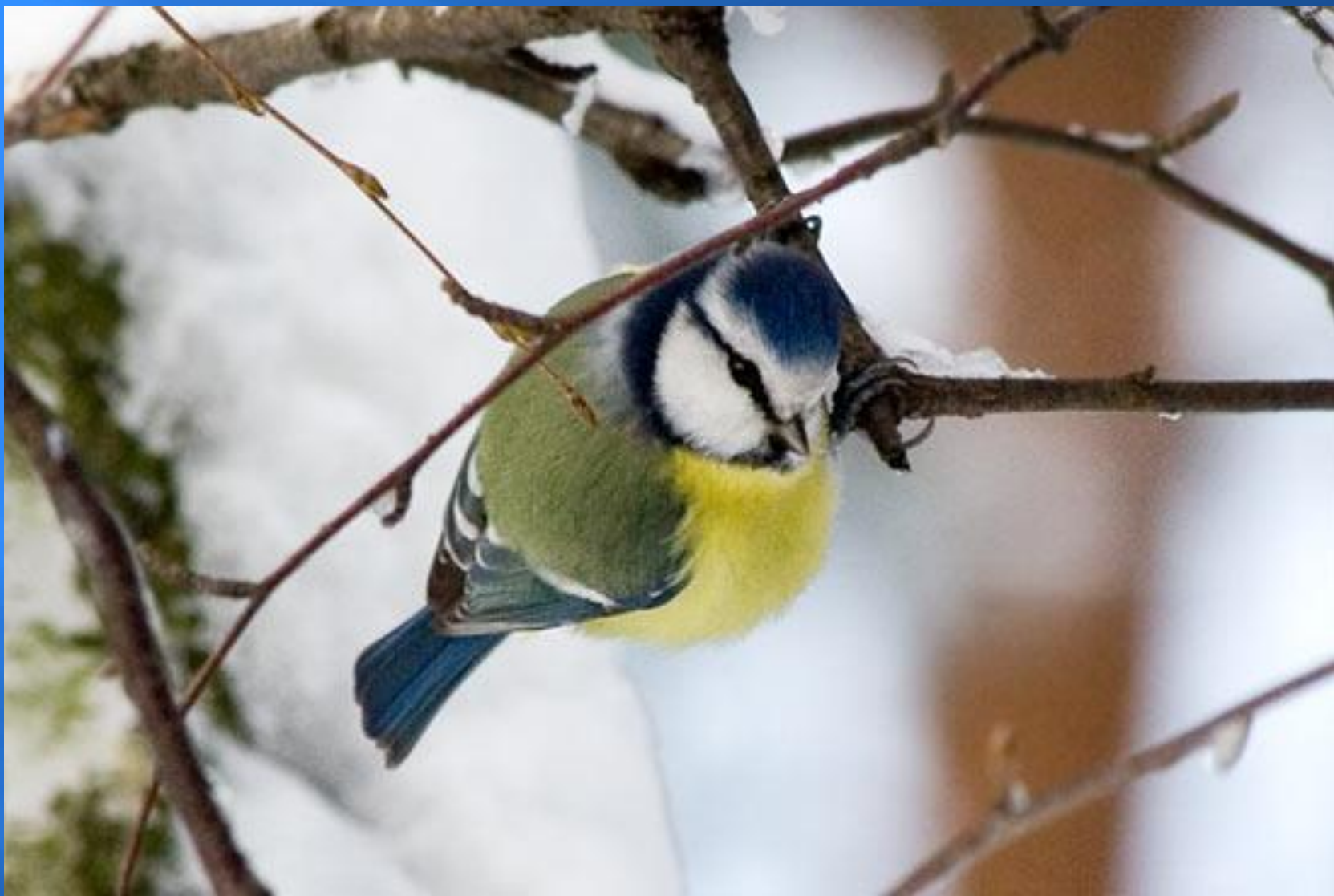
Красивая синичка – лазоревка.